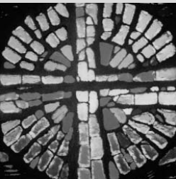
Vitrail à la chapelle des Sœurs à Bè, au Togo

Jean-Paul II, visite pastorale en Afrique, 6 mai 1989