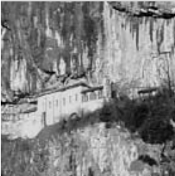
La chapelle de Notre-Dame du Scex, vue par la fenêtre centrale de la chapelle.

Nous avons vécu durant des mois au cœur du chantier, cherchant au fur et à mesure les moyens les meilleurs pour nous adapter à la situation.