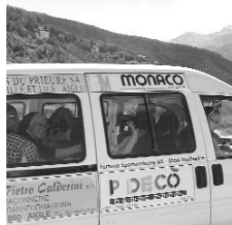
TOUTES, embarquées ...